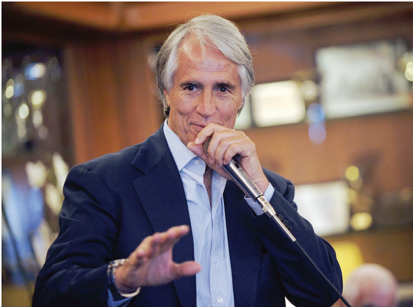
Il presidente del Coni Giovanni Malagò, 55 anni, ieri ha diffuso i dati antidoping di un anno di attività, da giugno 2013

CIFRE E RISORSE. Nella nottata tra martedì e ieri la Wada ha confermato l'Italia quinta per controlli con 6.816 test effettuati, dietro a Russia (14.582), Cina (13.364), Germania (7.709) e Usa (7.144). Dietro a noi potenze come il Giappone e l'Inghilterra. «Siamo anche il terzo Paese per positività riscontrate», ha aggiunto Malagò. Il dato medio ponderato delle positività tra l'attività del Coni e quella del Ministero della Sanità si colloca sul 2,5% (al Coni lo 0,9). «Può sembrare poco - ha commentato il numero uno del Coni - per me è rassicurante, perché vuol dire che senza questo frangiflutti creato, chissà che numeri di positività si correrebbe il rischio di commentare. Poi per me, anche solo 2 persone su 100 trovate con le mani nel sacco che cercano di alterare le prestazioni sportive, sono troppe. Soprattutto se sono atleti di vertice. Già lo 0,1% mi fa arrabbiare». Il calcio guida gli sport con 3.504 controlli