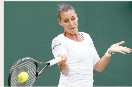
Flavia Pennetta, 32 anni, attuale n.1 azzurra

TROICKI - Scontata la squalifica per doping, dopo un anno di assenza il serbo Viktor Troicki rientrerà tra due settimane a Gstaad.